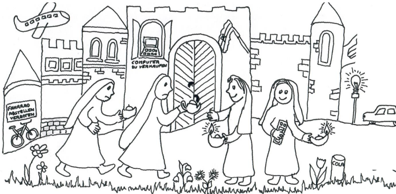
Idee und Gestaltung des Kinder-Kirchenblattes: Nicolette Doblhoff-Dier

Nur Jungfrauen die, waren die bereit, konnten Hochzeitssaal mit ihm in den gehen, wurde dann die Tür zugeschlossen.